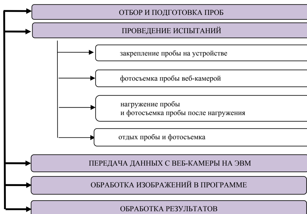
Рис. 1. Последовательность изучения деформационных свойств трикотажных полотен по гистограммам цифровых изображений

S_1 – суммарная площадь сквозных пор полотна после нагружения.