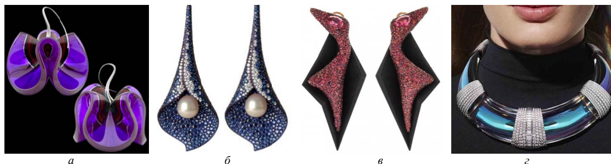
Рис. 2. Ювелирные украшения с нетрадиционными материалами: