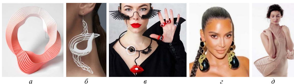
Рис. 4. Украшения в стиле авангард: а – браслет из полиамида, выращенный по 3D-технологии от Евгении Балашовой; б – серьги из полиамида от Ксении Загайновой; в – комплект из полимеров; г – серьги от Schiaparelli ; д – дерево и кристаллы Swarovski в коллекции украшений от Stephanie Bila

Заметим, что ювелирные изделия из нетрадиционных и нестандартных материалов столь