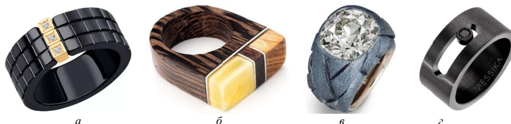
Рис. 1. Кольца с основой из различных нетрадиционных материалов:

ных пробок может стоить не меньше аналогичного изделия из драгоценного металла. Нетрадиционные материалы нередко выполняют функции конструкционных, например, являются основой колец из керамики, дерева, алюминия, титана или других материалов (рис. 1); могут придавать декоративность, оттеняя драгоценные материалы (окрашенный титан и алюминий, пластмасса, бумага и др.) вставками или элементами украшений (рис. 2).